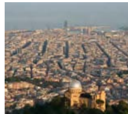
BCN des de dalt

Només cal que ens diguis quin tipus de visita busques, nosaltres ens encarreguem de la resta. Contacta'ns!