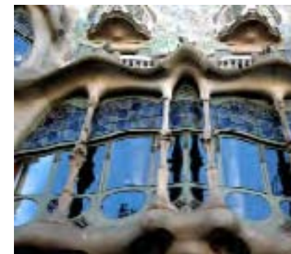
Joies de Gaudí