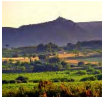
Penedès i Sitges