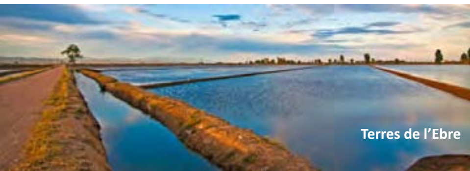
Terres de l'Ebre