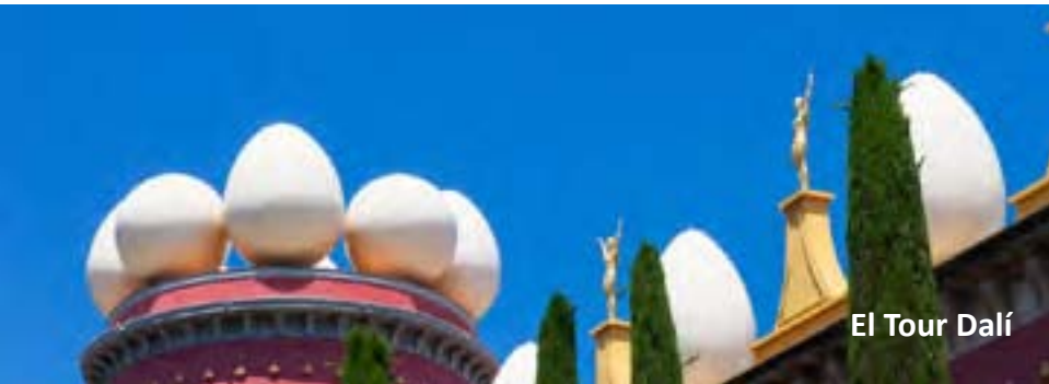
El Tour Dalí

Aquestes són només algunes possibilitats, demana'ns l'experiència que busques i nosaltres te l'organitzem!