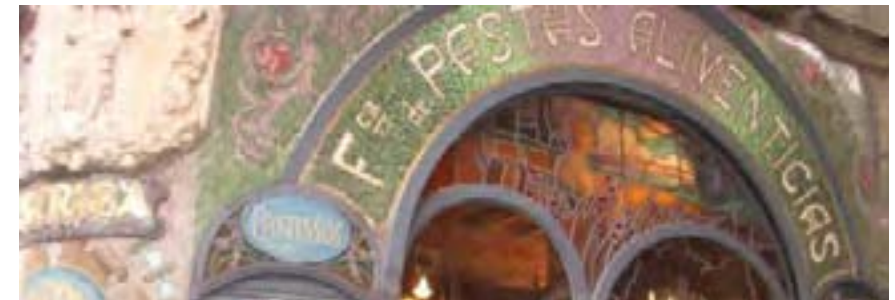
Botigues amb encant