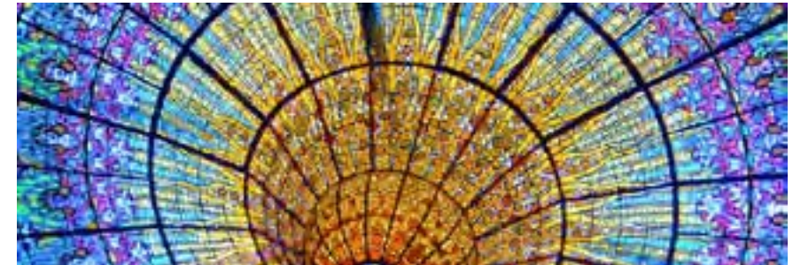
Modernisme a Ciutat Vella