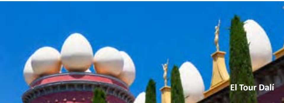
El Tour Dalí

¡Estas son sólo algunas posibilidades, pídenos la experiencia que buscas y nosotros te la organizamos!