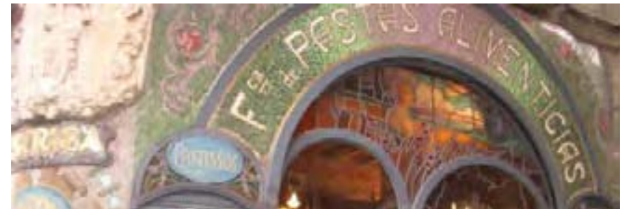
Comercios con encanto