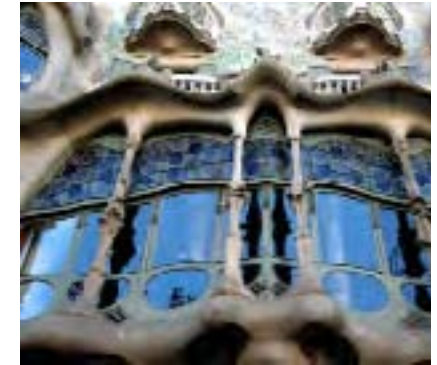
Joiès de Gaudí