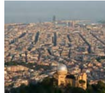
BCN des de dalt

Sólo hace falta que nos digas el tipo de visita que buscas, nosotros nos encargamos del resto. ¡Contáctanos!