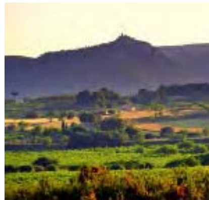
Penedès y Sitges