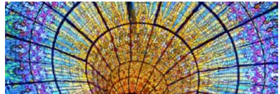
Modernismo en Ciutat Vella