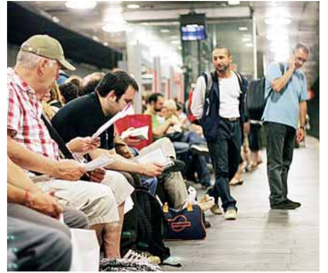
Los pasajeros se tuvieron que armar de paciencia de nuevo.

El sector hotelero vivirá dos o tres años duros en Barcelona debido a la situación económica, según la consultora Jones Lang LaSalle: se registrará un descenso de la ocupación y de los precios.