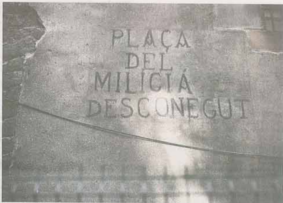
Plaça del milicia desconegut er mindested for den ukendte soldat.

30. januar 1938 slog en bombe ned midt på pladsen. Legende børn fra flygtningeherberget i den lokale kirke blev slynget i alle retninger, og da støvet havde lagt sig, lå 42 døde rundt omkring i murbrokkerne.