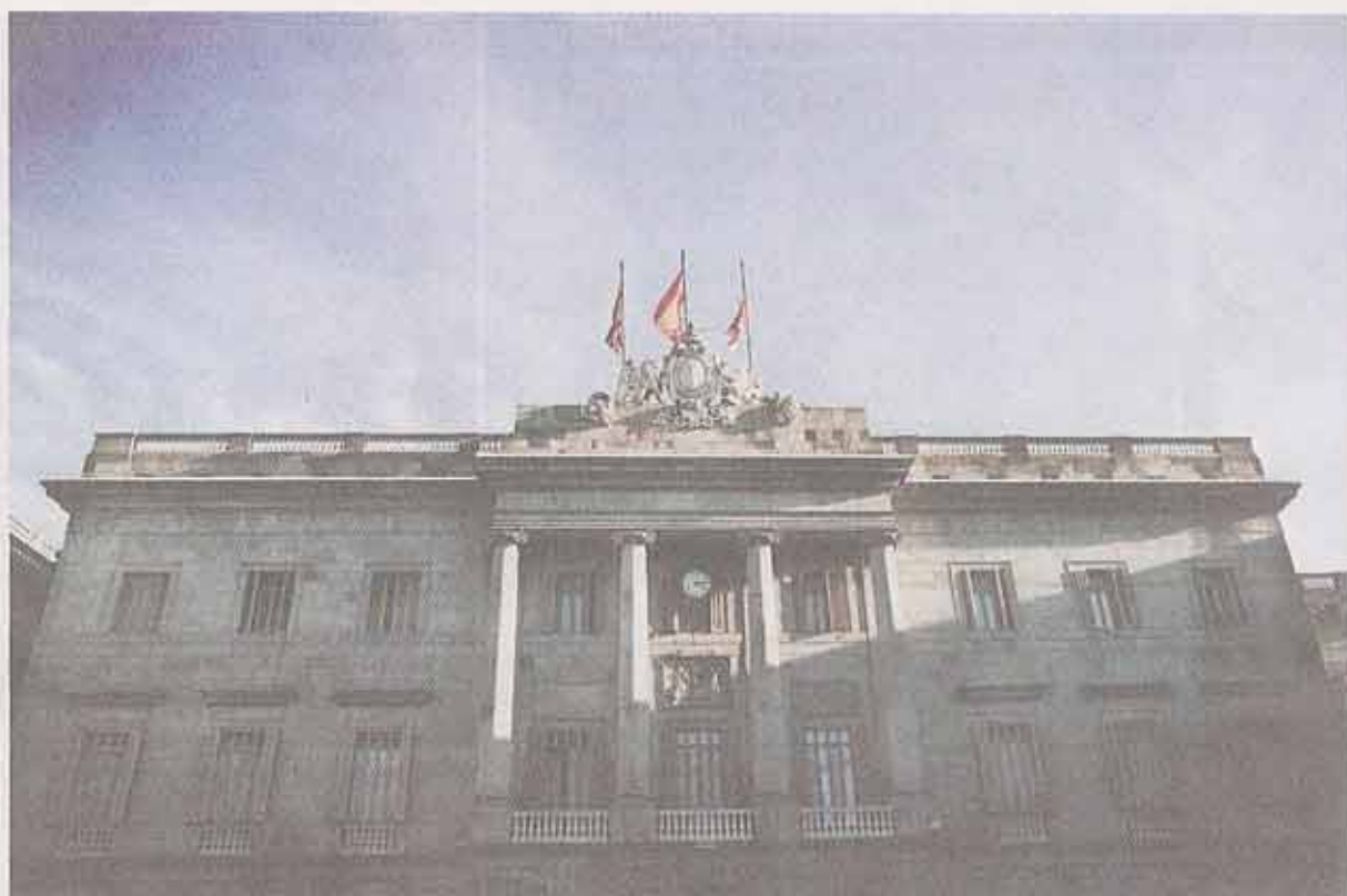
På Plaça Sant Jaume har Cataloniens regionale regering til huse.

Denne kølige vinterdag en menneskealder senere er et hiphop-band i gang med at skyde et par scener til en video. Det ser besynderligt ud, når de vrikker rundt til en musik, vi ikke kan høre. Men også de virker knugede. For ingen steder i Barcelona er sporene fra rædslerne under 1930'ernes spanske borgerkrig tydeligere end på Sant Felipe Neri.